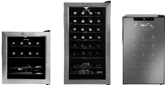
ADEGA LYON AD1511/22IX

LYON 13 garrafas / CANNES 18 garrafas / TOULOUSE 29 garrafas